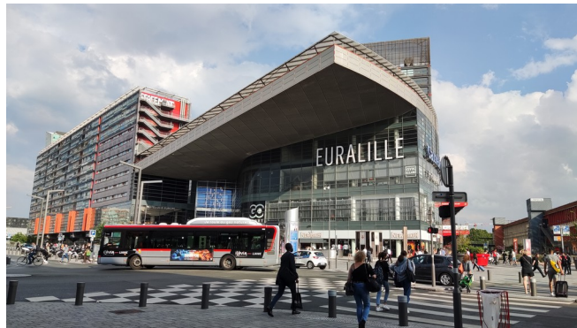
und hochmoderne Stadtviertel.