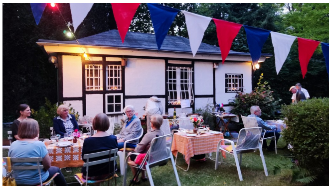
FKL-Gartenfest am 14. Juli

Der Verein organisiert außerdem für seine Mitglieder Restaurantbesuche, Spaziergänge und kulturelle Aktivitäten, vorzugsweise mit Bezug zu Frankreich.