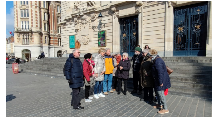
Stadtführung in Lille