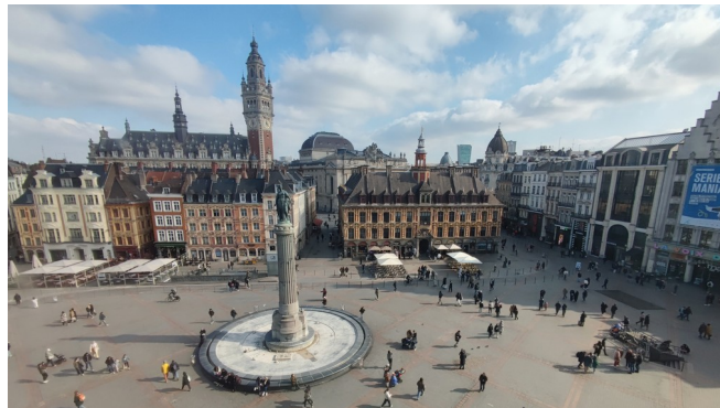
Lille hat eine wunderschöne Altstadt

Unsere beiden Partnerstädte trennen lediglich 330 km. Diese geringe Distanz vereinfacht häufige und sogar spontane Treffen.