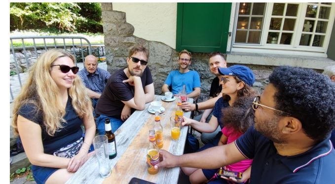
Wanderung im Siebengebirge

Insbesondere wechselseitige Besuche in Köln und Lille tragen zur deutsch-französischen Freundschaft bei. Wenn es möglich ist, sind die Gäste bei Gastfamilien untergebracht, um den persönlichen Austausch zu stärken.